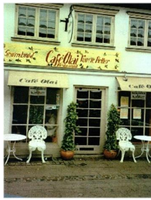
Restaurant Café Olai Sct Olaigade 19 3000 Helsingør (Elsinore) Phone +45 49201607